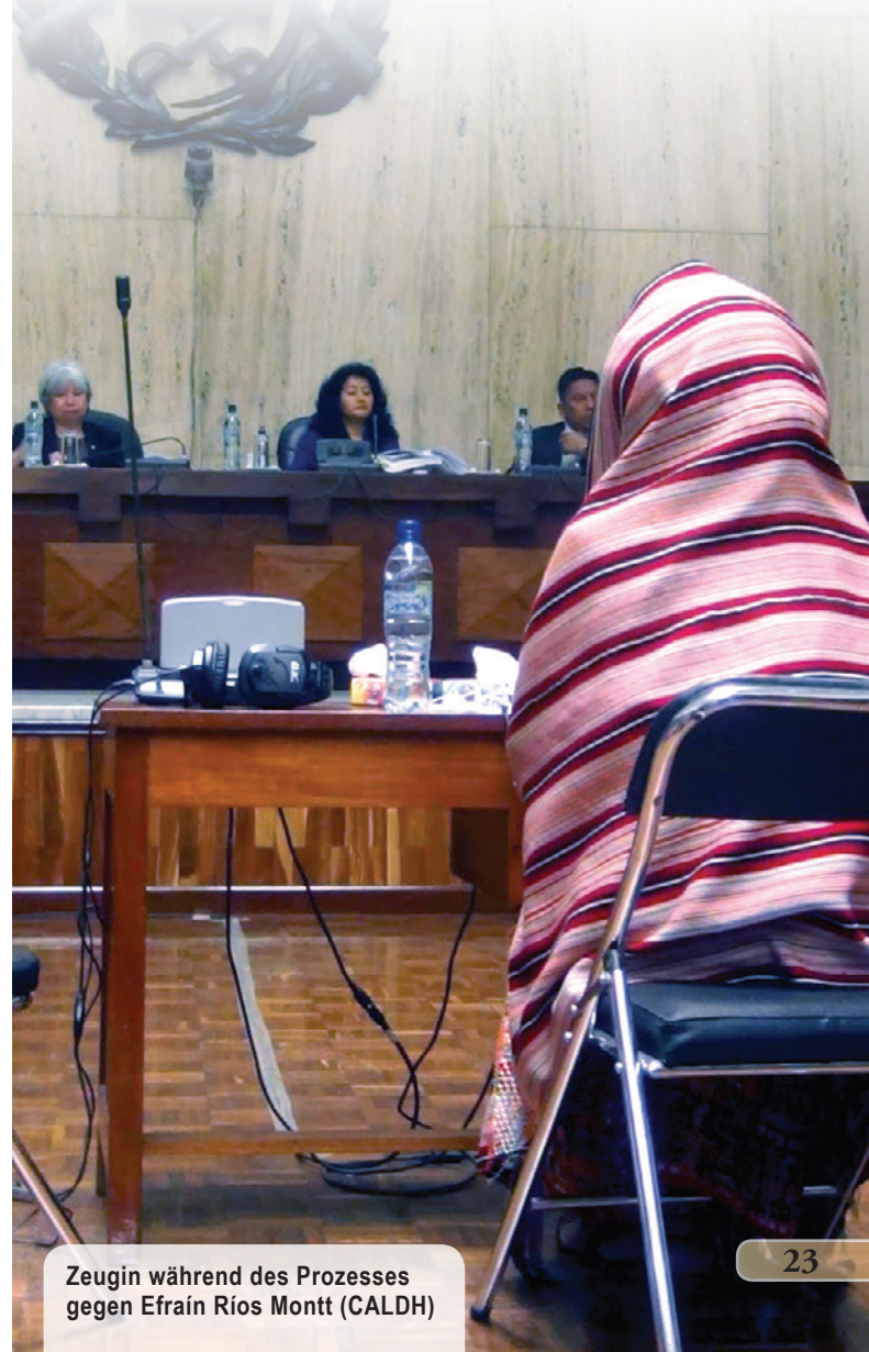
Zeugin während des Prozesses gegen Efraín Ríos Montt (CALDH)