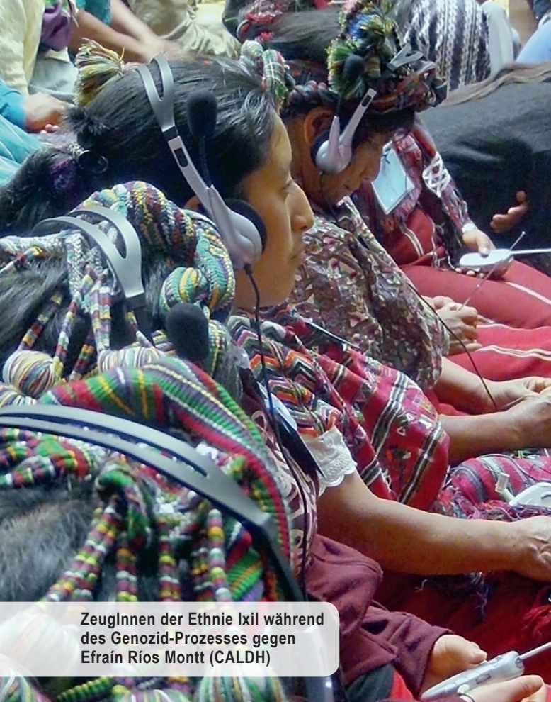
ZeugInnen der Ethnie Ixil während des Genozid-Prozesses gegen Efraín Ríos Montt

Die Gemeinde befand sich auf dem Gebiet, auf dem die damalige Militärregierung das Wasserkraftwerk Chixoy baute, dessen Stausee mehrere Gemeinden überflutete. Die Verhandlungen der betroffenen Gemeinden und Überlebenden über Entschädigungen mit der Regierung sind immer wieder gescheitert. Obwohl sie neben dem größten Wasserkraftwerk des Landes wohnen, haben sie bis heute keinen Strom. Das Urteil des Interamerikanischen Gerichtshofes ordnete an, die Verantwortlichen der Massaker zur Rechenschaft zu ziehen und Wiedergutmachungsmaßnahmen zu ergreifen. Die betroffenen Gemeinden haben sich inzwischen in dem Verbund Cocahich organisiert und stehen seit 2010 mit der Regierung in Verhandlung über einen Entschädigungsplan, der die Vergabe von Häusern, Land, finanzielles Entgelt aber auch den Bau von Schulen und Gesundheitsstationen vorsah. Dieser Plan wurde bisher nicht umgesetzt.