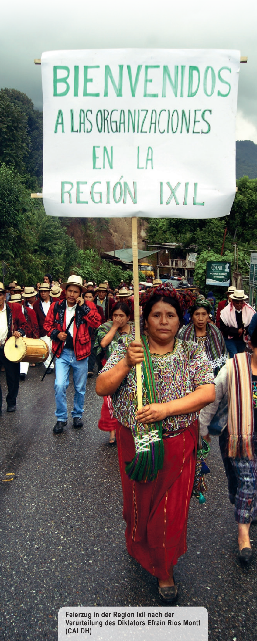
Feierzug in der Region Ixil nach der Verurteilung des Diktators Efraín Ríos Montt

Am 29. Dezember 1996 wurden die Friedensabkommen zwischen den Regierungsvertretern und der revolutionären Bewegung URNG (Unidad Revolucionaria Nacional Guatemalteca) unterzeichnet. Die Friedensabkommen sind nicht nur Waffenstillstandsabkommen, sondern stellen auch eine Agenda für einen sozialen und politischen Wandel dar. Sie enthalten u.a. Vereinbarungen zur Einhaltung der Menschenrechte, geschichtlichen Aufarbeitung von Menschenrechtsverletzungen, Wiedereingliederung der vertriebenen Bevölkerung in die Gesellschaft, Förderung der indigenen Identität und Rechte, Verbesserung sozioökonomischer Aspekte und der Agrarsituation, Abbau und Umstrukturierung des Heeres, Stärkung eines repräsentativen demokratischen Systems, Reformen des Rechtssystems und Förderung der Bürgerbeteiligung 4 . Der Prozess der Umsetzung der Friedenverträge wurde ca. 8 Jahre von einer Mission der Vereinten Nationen in Guatemala (Misión de Verificación de las Naciones Unidas en Guatemala, MINUGUA) begleitet.