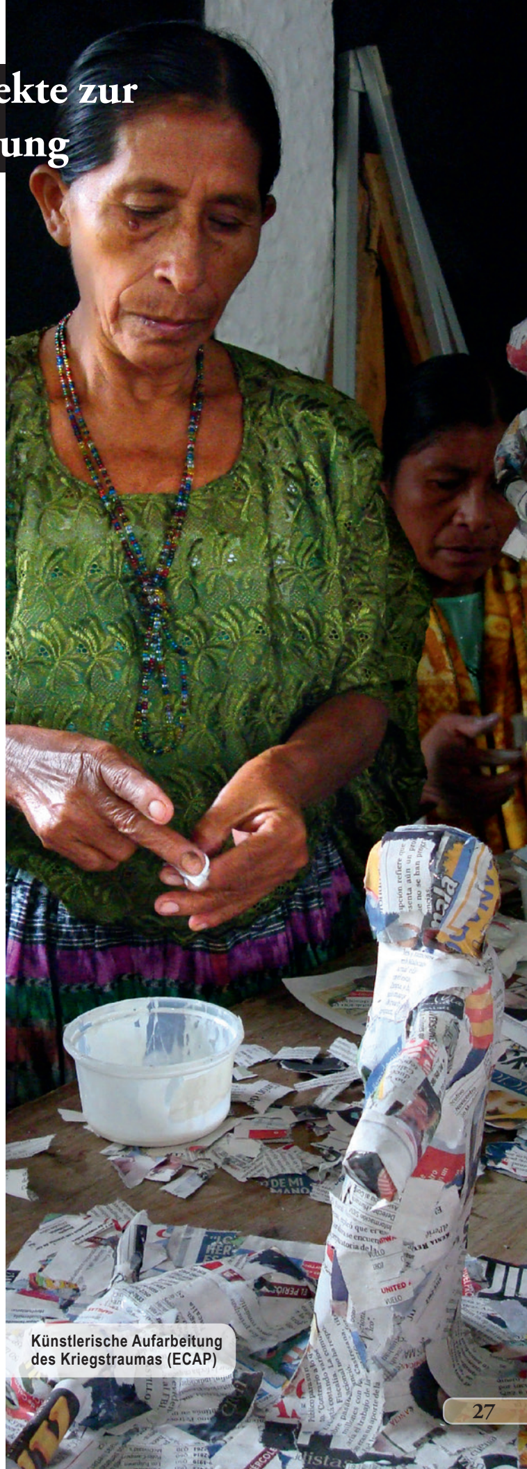
Künstlerische Aufarbeitung des Kriegstraumas (ECAP)

Angesichts dieser Verbrechen an Maya-Frauen hat die Organisation für Sozialforschung und psycho-soziale Arbeit in lokalen Kontexten (ECAP) beschlossen, Frauen, die als Opfer sexueller Gewalt den Bürgerkrieg überlebt haben, in psychologischer und sozialer Hinsicht zu betreuen. Seitens des Staates erfolgte keinerlei psychosoziale Betreuung der Überlebenden. Das Projekt “Das Schweigen brechen - Psycho-soziale Begleitung und Stärkung von Frauen, die während des Bürgerkrieges Opfer sexueller Gewalt wurden” , wird vom ZFD der GIZ seit 2008 unterstützt. Schon im Jahr 2004 bildeten die Nationale Union guatemaltekischer Frauen (UNAMG) und ECAP eine Allianz für den Kampf um Gerechtigkeit für die Frauen. Das Ziel der Allianz besteht darin, einen umfassenden Prozess anzustoßen: sexuelle Gewaltverbrechen werden thematisiert, die überlebenden Opfer psychosozial begleitet und, wenn sie sich entscheiden, den Rechtsweg zu beschreiten und Gerechtigkeit einzufordern, auch in diesem Anliegen unterstützt. Seit 2005 arbeitet die Initiative mit indigenen Frauen aus besonders betroffenen Regionen zusammen.