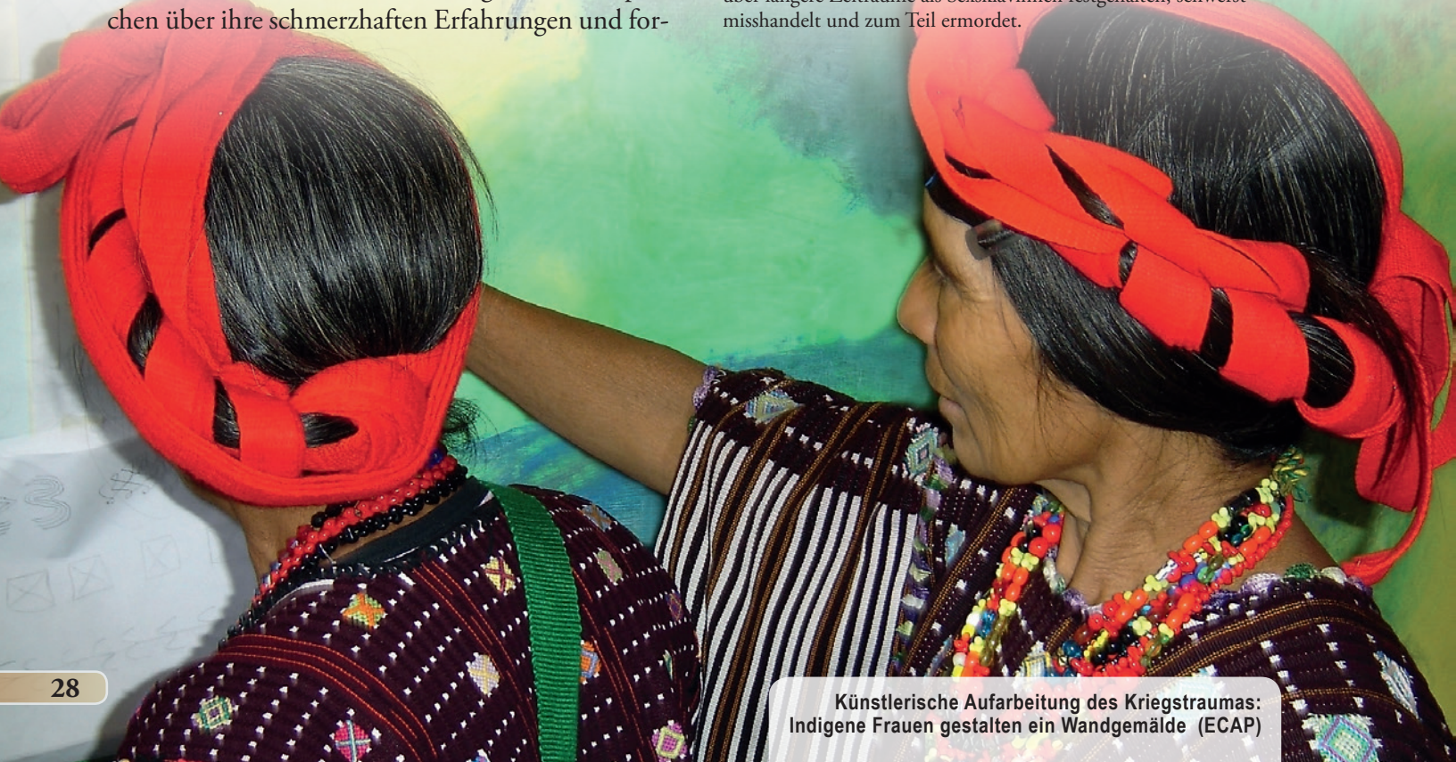
Künstlerische Aufarbeitung des Kriegstraumas: Indigene Frauen gestalten ein Wandgemälde (ECAP)