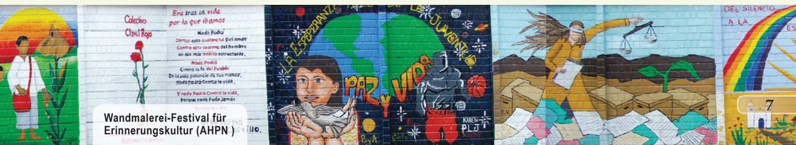
Wandmalerei-Festival für Erinnerungskultur (AHPN)

in Guatemala und Advocacy-Arbeit mit guatemaltekischen EntscheidungsträgerInnen und dem diplomatischen Sektor. Der ZFD der GIZ unterstützt zivilgesellschaftliche und staatliche Partner in der Umsetzung des Friedensprozesses. Ein besonderes Augenmerk legt er auf die Unterstützung der Aufarbeitung der schweren Menschenrechtsverletzungen während des Bürgerkriegs. Darüber hinaus fördert er den Schutz der Menschenrechte in der Gegenwart, stärkt die soziale Kohäsion und soziale Netzwerke und fördert die friedliche Transformation aktueller sozialer Konflikte.