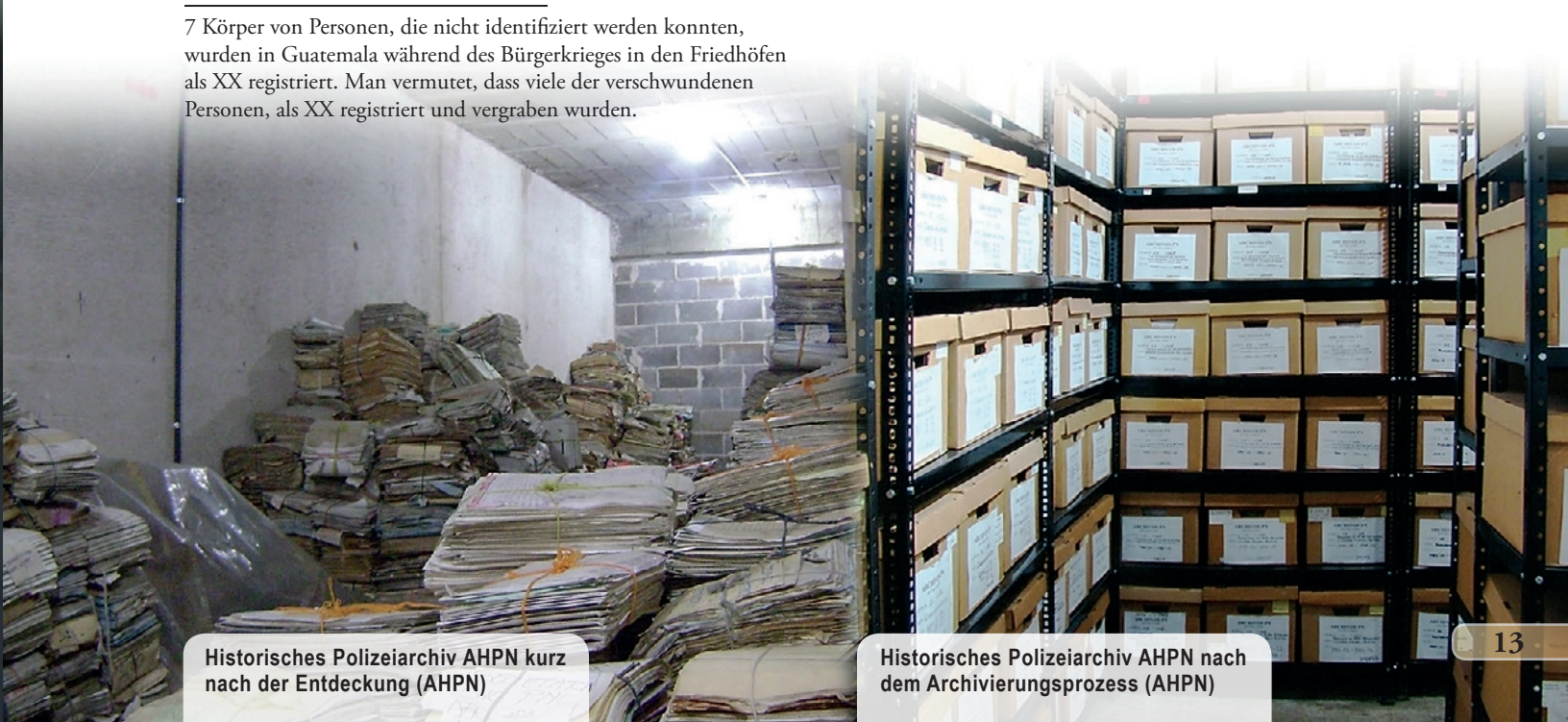
Historisches Polizeiarchiv AHPN kurz nach der Entdeckung

Im Jahr 2005 wurde das Historische Archiv der Nationalen Polizei (Archivo Histórico de la Policía Nacional, AHPN) entdeckt, dessen Existenz von der Regierung stets geleugnet wurde. Es handelt sich um rund 80 Millionen Akten und Dossiers, die die Zeitspanne von 1882 bis 1997 dokumentieren. Neben vielen verwaltungstechnischen Details enthalten die Dokumente auch verschlüsselte Informationen zu Menschenrechtsverletzungen, die in der Zeit des Bürgerkrieges von staatlichen Institutionen (Polizei, Militär, Geheimdienst) begangen wurden. Das Archiv wurde zunächst von der Nationalen Menschenrechtsbehörde (Procuraduría de Derechos Humanos, PDH) sichergestellt, inzwischen ist es dem Kulturministerium zugeordnet. Die Dokumente müssen einem spezifischen Prozess der Säuberung, Archivierung, Digitalisierung und