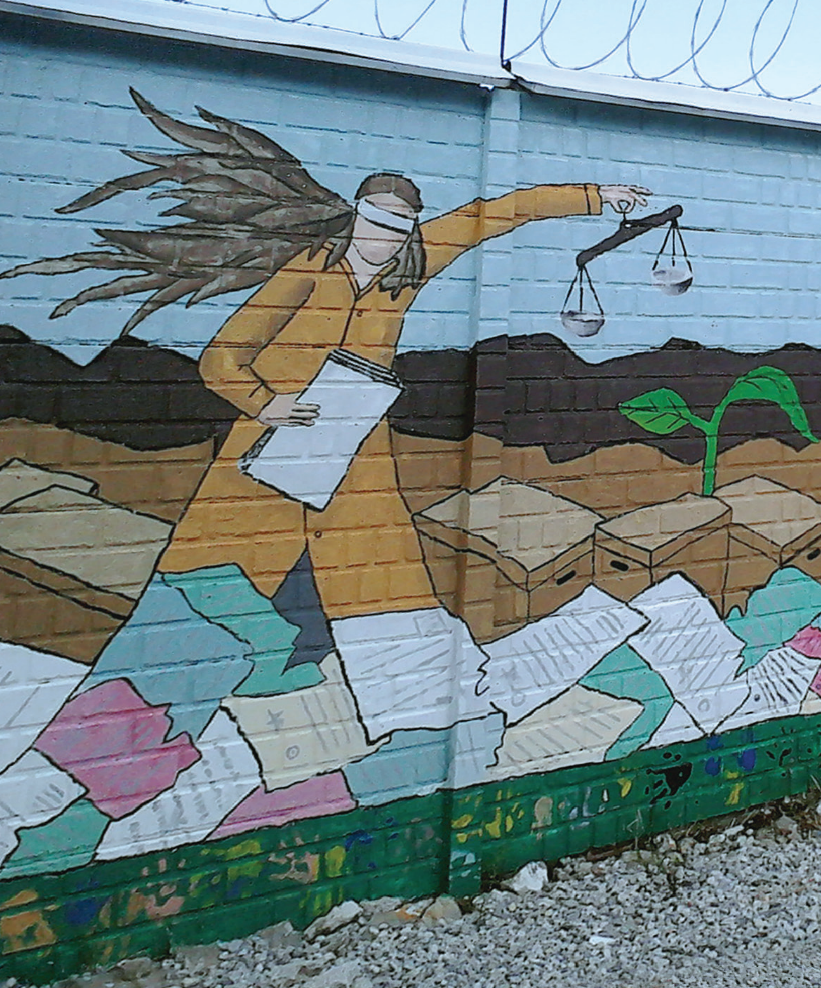
Wandmalerei, Produkt des Festivals für Erinnerungskultur auf dem Areal des AHPN (Fundación Guillermo Torriello)