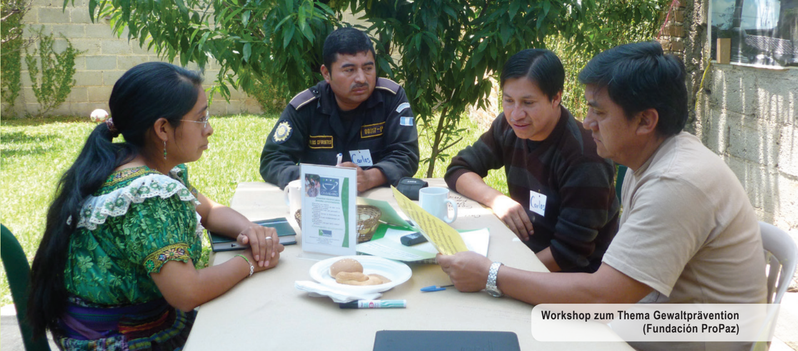
Workshop zum Thema Gewaltprävention (Fundación ProPaz)