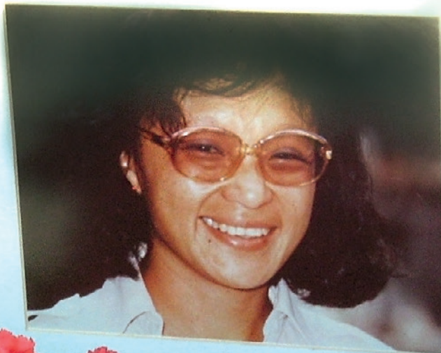
Gedenkstätte für die im Bürgerkrieg ermordete Anthropologin Myrna Mack (FMM)

durch Infrastrukturprojekte, Bau von Schulen und sozialen Einrichtungen und kulturelle Entschädigung, wie Förderung lokaler Sprachen, Traditionen und lokaler Erinnerungskultur.