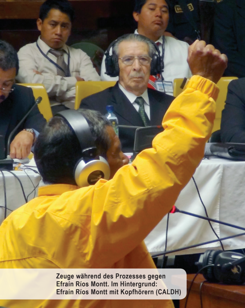
Zeuge während des Prozesses gegen Efraín Ríos Montt. Im Hintergrund: Efraín Ríos Montt mit Kopfhörern (CALDH)