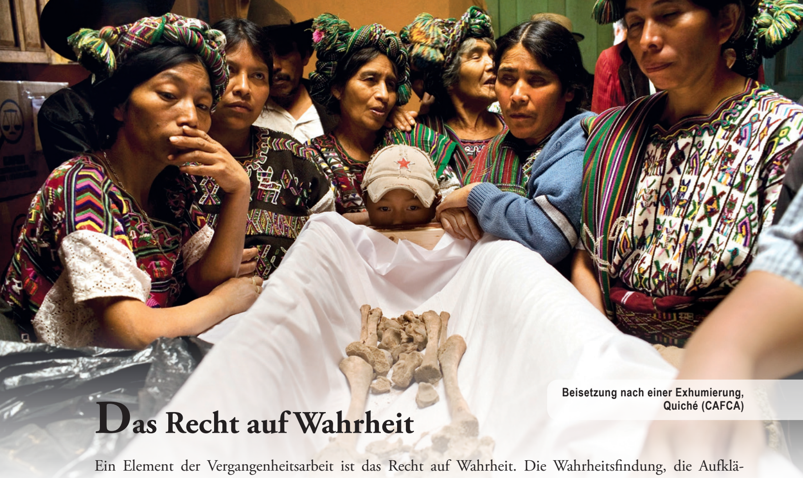
Beisetzung nach einer Exhumierung, Quiché (CAFCA)