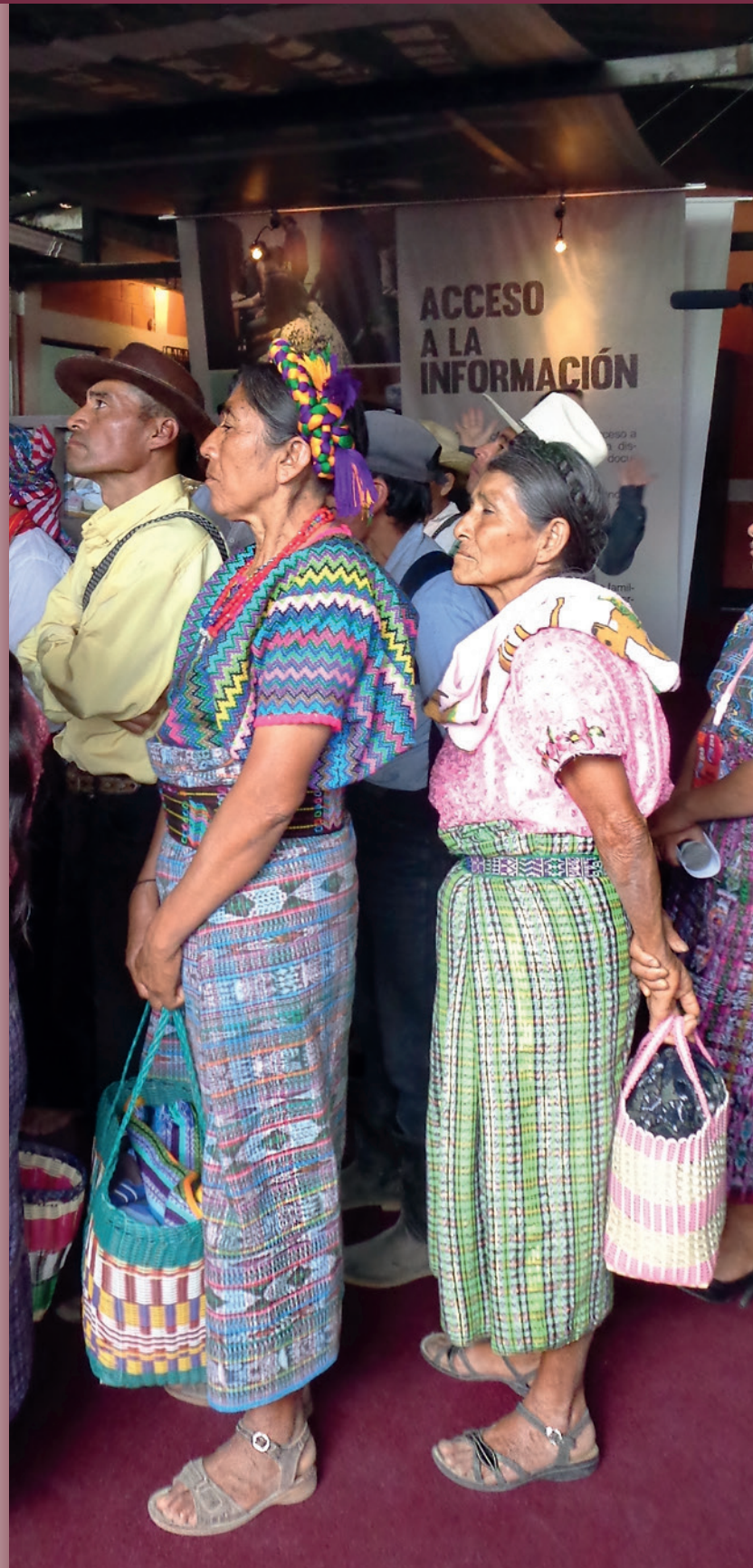
AusstellungsbesucherInnen der Ausstellung "Das Recht auf Zugang zu Information" in Rabinal (ZFD)

Eine Wanderausstellung zum Recht auf Zugang zu Information, zur Bedeutung des Historischen Polizeiarchivs für die Vergangenheitsarbeit und die Wichtigkeit der Einrichtung nationaler und lokaler Gedenkstätten mit erinnerungspädagogischem Ansatz, wurde entwickelt und im Rahmen der Thementage vorgestellt. Die Deutsche Welle Akademie führte in diesem Zusammenhang Fortbildungen von JournalistInnen durch, um diese für eine sensible Berichterstattung zur Vergangenheitsaufarbeitung zu schulen. Es entstand eine Website, auf welcher die JournalistInnen ihre, im Rahmen der