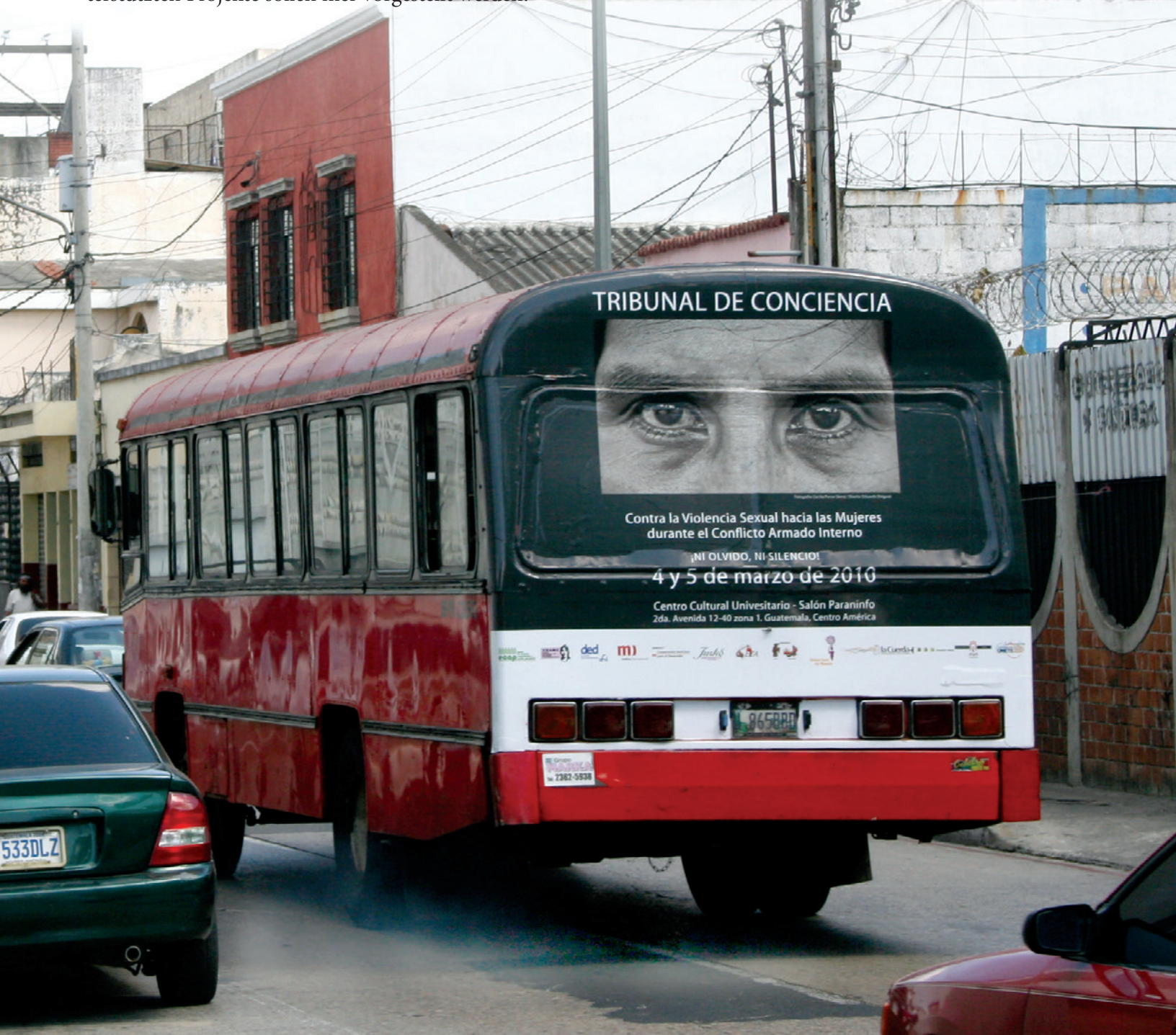
Bus in der Hauptstadt mit Ankündigung für das Gewissenstribunal vom Jahr 2010 (ECAP)

Auf den folgenden Seiten werden die wichtigsten Meilensteine ihrer Arbeit in den vier Bereichen der Transitional Justice vorgestellt: Wahrheit, Gerechtigkeit, Reparationen und Nicht-Wiederholung. Der ZFD der GIZ unterstützt seit 2000 verschiedene Partnerorganisationen auf diesem Weg und fördert Projekte unterschiedlichster Art. Seit über fünf Jahren begleitet er ein Netzwerk zivilgesellschaftlicher Organisationen, die sich zum Thema Vergangenheitsarbeit austauschen und gemeinsame Aktivitäten koordinieren. Einige der vom ZFD unterstützten Projekte sollen hier vorgestellt werden.