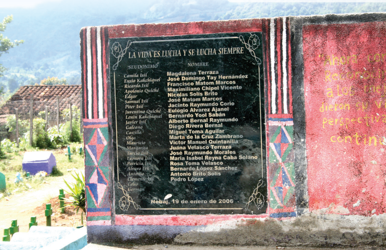
Erinnerungstafel an die während des Bürgerkrieges Verstorbenen, Nebaj, Quiché (CAFGA)