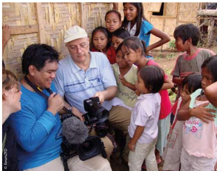
Umringt von Kindern begutachten Redakteur und Kameramann die Ergebnisse des Filmdrehs in einer Flüchtlingsiedlung

Jahres 2008 vor den Kämpfen zwischen der Armee und der MILF flohen. In dem Jahr wurde in Mindanao die größte Zahl neuer Binnenflüchtlinge weltweit verzeichnet. Die erneute Eskalation des Konflikts war umso überraschender, als im August 2008 ein Abkommen zwischen Regierung und MILF kurz vor der Unterzeichnung stand, das wichtige Streitpunkte regelte und den Weg für einen vertraglichen Frieden frei machen sollte. Gegner des Abkommens hatten jedoch mit einer Klage vor dem Verfassungsgericht Erfolg und brachten es in letzter Minute zu Fall. Trotz des weiterhin geltenden Waffenstillstands griffen daraufhin einige Kommandeure der MILF zu den Waffen. Die Armee reagierte mit umfangreichen Operationen unter dem Vorwand, drei Kommandeure der MILF verhaften zu wollen. Die Folge: Krieg in großen Teilen Zentralmindanaos und Hunderttausende auf der Flucht.