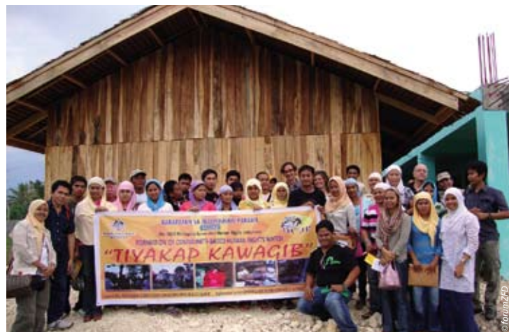
Teilnehmende eines Seminars zum Thema Menschenrechtsbeobachtung in Pikit, Zentralmindanao. Sie werden für ihr Engagement als freiwillige Menschenrechtsbeobachter geschult.

Eine der Organisationen, mit denen das forumZFD zusammenarbeitet, ist Bantay Ceasefire, was in etwa »Wächter des Waffenstillstands« bedeutet. Mehr als 600 meist junge Freiwillige engagieren sich in der Konfliktregion als »Beobachterinnen« und »Beobachter« für die Organisation. Ihre wichtigste »Waffe« ist das Mobiltelefon. Damit sind sie in der Lage, Verletzungen des Waffenstillstands in Sekundenschnelle via Textnachrichten weiterzugeben und somit nach Möglichkeit zum Abbruch der Kampfhandlungen