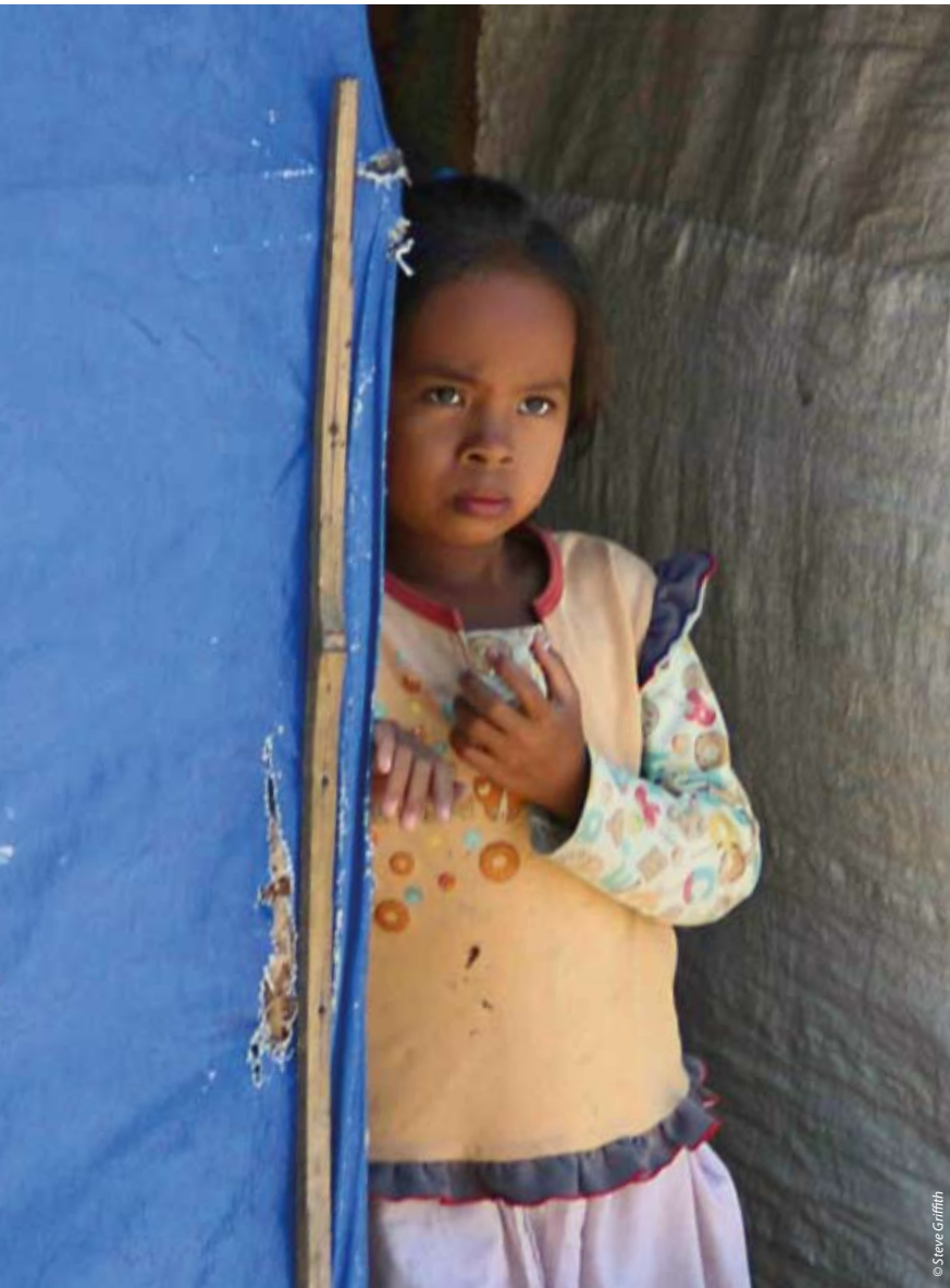
Einige Flüchtlinge leben bis heute in provisorischen, nur mit Planen notdürftig abgedeckten Hütten im Flüchtlingslager in Datu Piang, Zentralmindanao

Unter dem Dach der hoch aufragenden Kokospalmen stehen dicht an dicht Bambushütten auf Holzpflocken in der grau-braunen, matschigen Erde. Bei jedem Schritt klebt sich eine neue Schicht Matsch an die Sohlen der Sandalen. Die Luft ist schwül, Feuchtigkeit hängt in der Kleidung. Die großen Palmblätter verdecken den Himmel und tauchen das Flüchtlingslager in grünlich schimmerndes Licht.