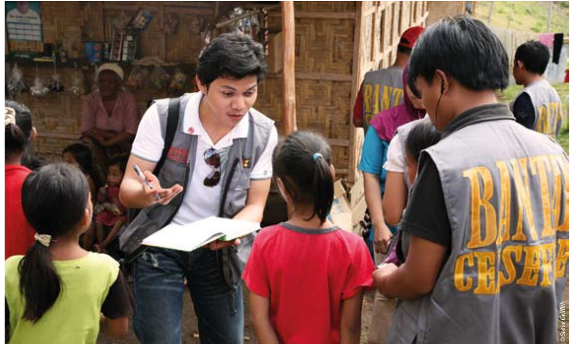
Die Freiwilligen von Bantay Ceasefire interviewen regelmäßig die Bewohner der Flüchtlingslager, um Menschenrechtsverletzungen zu dokumentieren