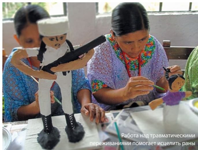
Работа над травматическими переживаниями помогает исцелить раны