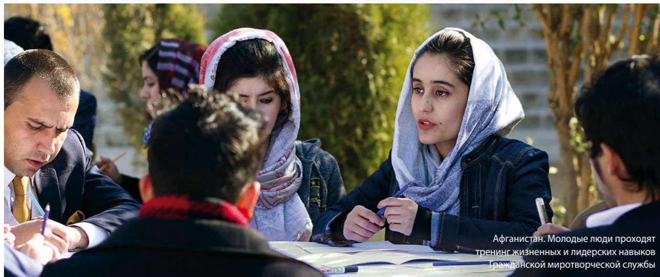
Афганистан. Молодые люди проходят тренинг жизненных и лидерских навыков Гражданской миротворческой службы