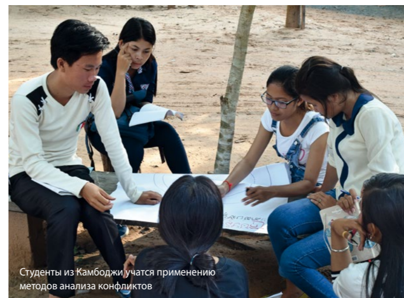
Студенты из Камбоджи учатся применению методов анализа конфликтов