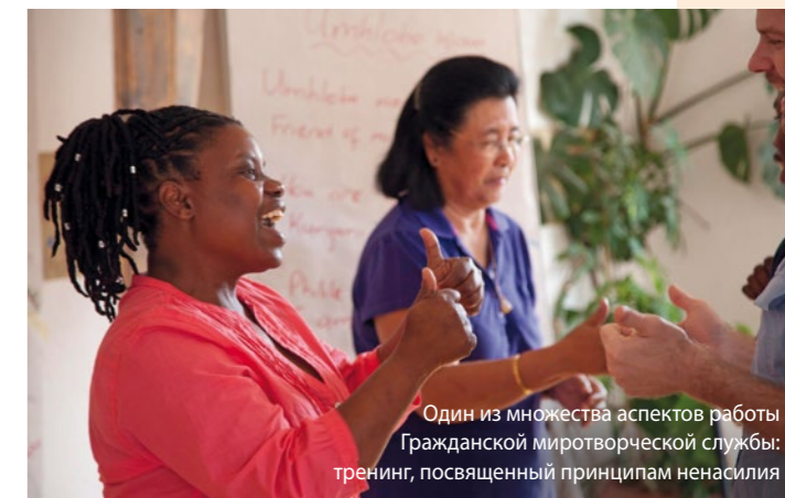
Один из множества аспектов работы Гражданской миротворческой службы: тренинг, посвященный принципам ненасилия