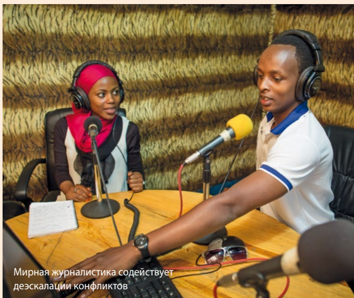
Мирная журналистика содействует деэскалации конфликтов

В Колумбии правительство и повстанцы группировки ФАРК подписали мирное соглашение. Но для того, чтобы сохранить мир на долгое время, нужно заживить раны общества, разорванного войной, и заново научиться жизни бок о бок. Для этого важна конструктивная атмосфера. Специалисты Гражданской миротворческой службы обучают колумбийских журналистов чуткому обращению с новостями о мирном процессе для того, чтобы снять напряжение, а не нагнетать его. Гражданская миротворческая служба могла бы помочь СМИ работать на благо мира и в других странах. Для этого необходимо расширить деятельность службы.